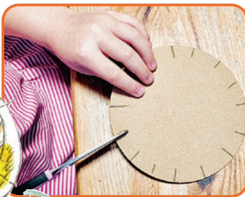
Po obvodu papierového kolieska vystrihni zárezy.

Nemusíš byť pavúk, no pavučinku si vieš vytvoriť z farebných klobiek nití. Potrebuješ okrem nich ešte nožnice, fixu a tvrdý papier alebo kartón.